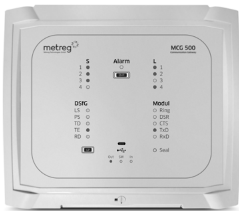
MODBUS-DSFG-GATEWAY MIT LTE MODUL MCG 500 COMPACT

Artikelbezeichnung Preis / Stück € MCG 500 Compact Auf Anfrage