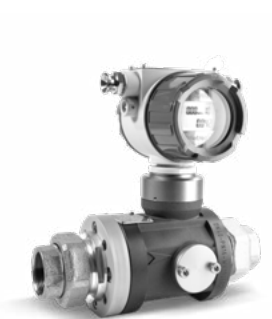
QUANTOMETER ELEKTRONISCH MQMe DN25