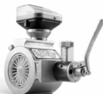
QUANTOMETER MECHANISCH mit Ölpumpe MQM DN80