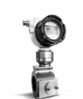
QUANTOMETER ELEKTRONISCH MQMe DN50