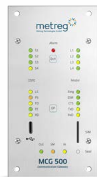
MODBUS-DSFG-GATEWAY MIT LTE MODUL MCG 500 19" KOMPAKT

Artikelbezeichnung Preis / Stück € MCG 500 19" Kompakt Auf Anfrage