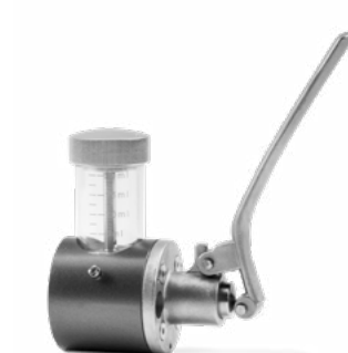
ÖLPUMPE zur Lagerschmierung (optional)