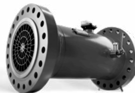
TURBINENRADGASZÄHLER MTM DN300 G2500 PN100