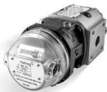
DREHKOLBENGASZÄHLER MRM DN25 G10